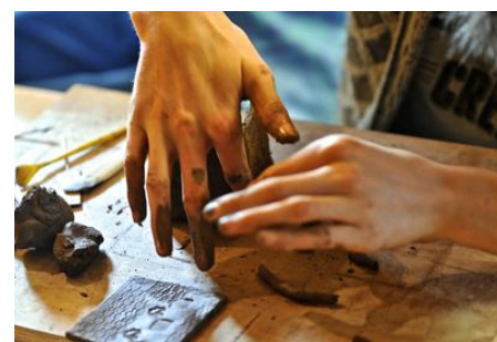
Visite d'exposition, vannerie Adrian Charlton @JY Le Dorlot ; « Intérieur-Extérieur-Passage » design Samuel Accoceberry avec Benoît Obé, ébéniste @Bernard Dupuy; vue d'atelier © Jean-Yves Le Dorlot – Pnr-PL